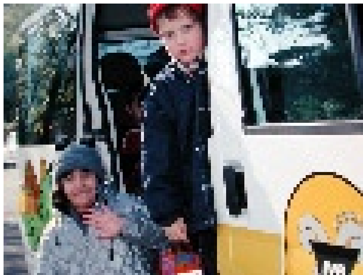
Gerade für Kinder ist ein sicherer Transport zur Schule ein wichtiger Bestandteil ihres Alltags.

Seit dem Sommer 2001 fahren sämtliche Schulkinder der Heilpädagogischen Schulen Basel-Stadt mit neuen IVB-Schülerbussen täglich zum Unterricht.